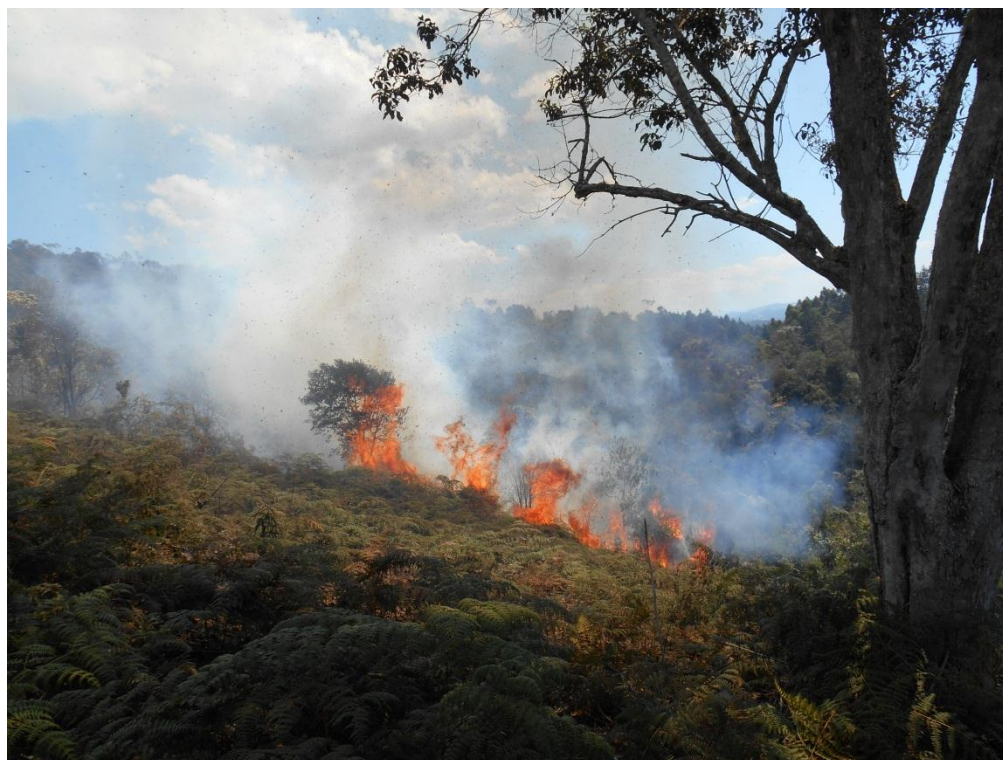
Foto 01: Vista da área de ocorrência do incêndio na coordenada geográfica WGS 84 290011/7745433