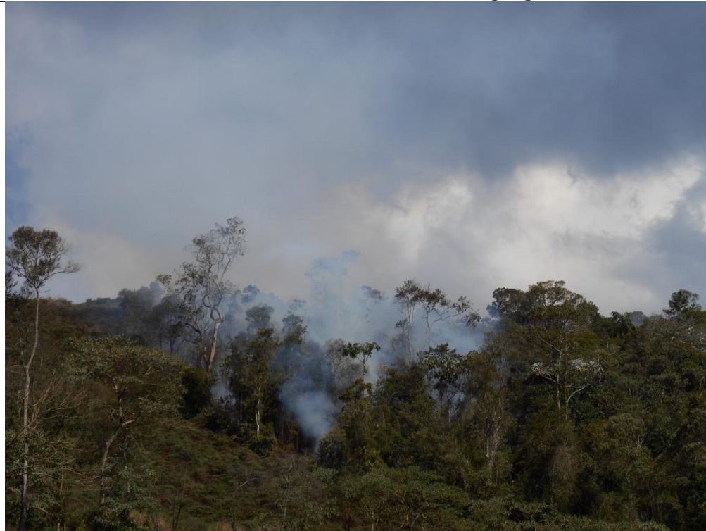
Foto 02: Vista da área de ocorrência do incêndio na coordenada geográfica WGS 84 289830/7745506